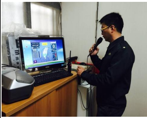
廣播發佈地震狀況