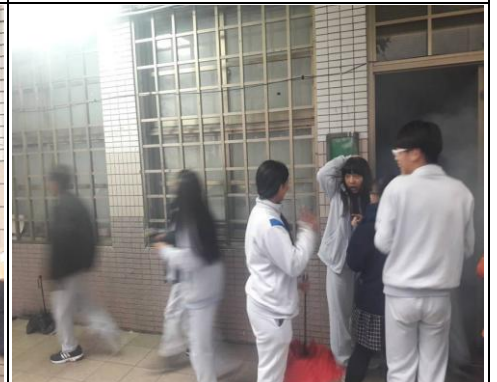
模擬煙霧現場逃生