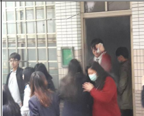
模擬煙霧現場逃生