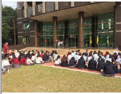
人員集合並清查人數