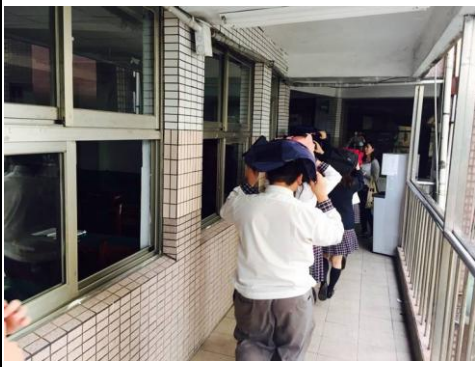
模擬地震逃生要領