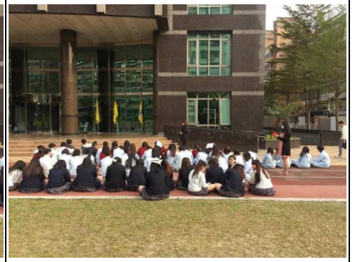
人員集合並清查人數